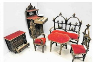
Die Sonderausstellung zeigt im Oberharzer Bergwerksmuseum die Vielseitigkeit des Materials Holz.

Die Ausstellung bringt Objekte aus zwölf Museen und weiteren Leihgaben zusammen, ergänzt durch acht zeitgenössische Holzkunstwerke junger Künstlerinnen und Künstler. Zu sehen sind Exponate vom schweren Weserfloß über einen filigranen Thronessel aus Harzer Fichtenspänen bis hin zu einer originalen Harzer Zither von 1837. Diese Zither stammt aus dem Altbestand des früheren Oberharzer Museums in Zellerfeld und steht stellvertretend für eine besondere Musikkultur. Dem „Bau und Spiel der Waldzither in Thüringen und im Harz“ werden in diesem Frühjahr von der Unesco in die Liste des immateriellen Weltkulturerbes aufgenommen.